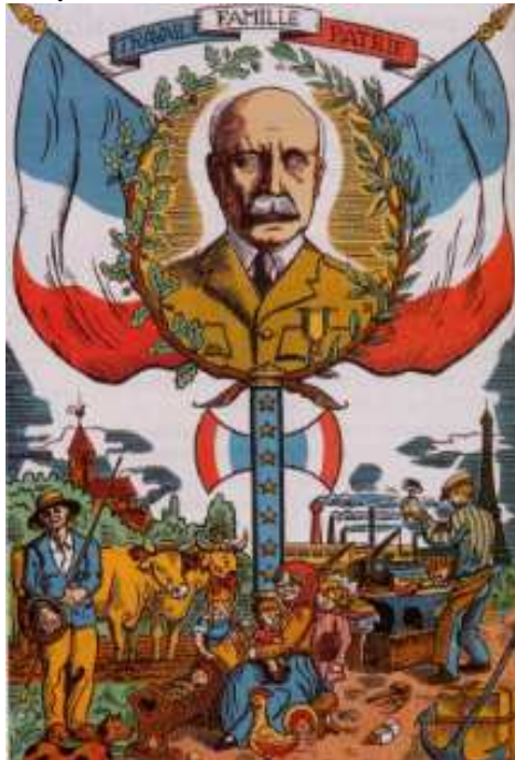
La nouvelle devise de la France est : Travail, Famille, Patrie

Il supprime le suffrage universel (droit de vote), les partis politiques, les syndicats et le droit de grève. La « révolution nationale » propose le retour à la terre et à la tradition. Les femmes mariées doivent quitter leur emploi et retourner au foyer.