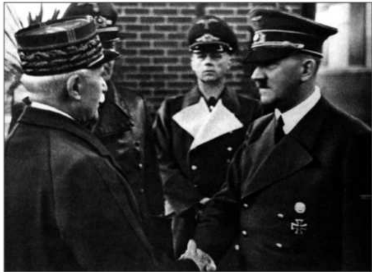
La poignée de main entre Pétain et Hitler, à Montoire

■ 24 octobre 1940 : Pétain rencontre Hitler à Montoire.