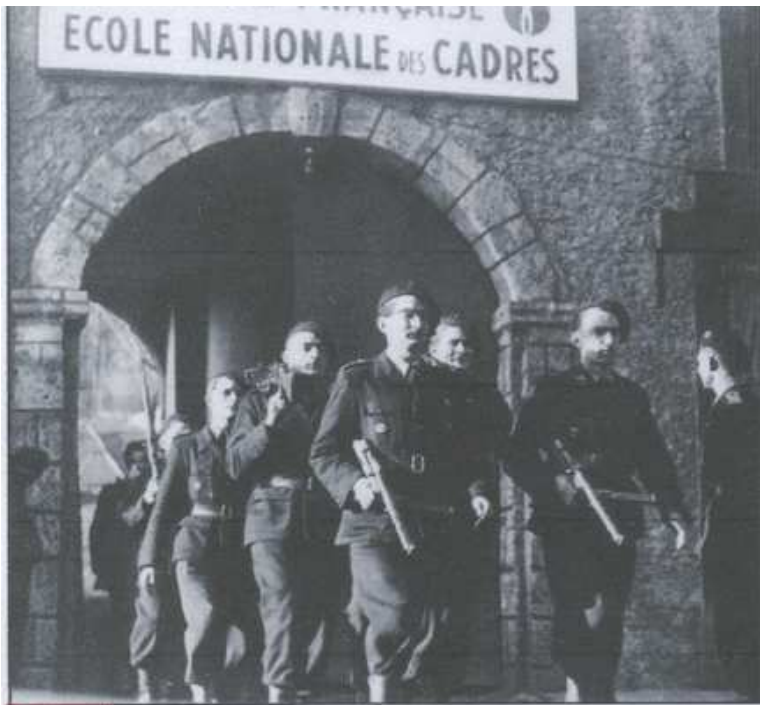
Doc. 3 Miliciens à Uriage, dans le département de l'Isère, 1941. Certains Français ont décidé de s'engager dans la milice française, organisation armée fondée par le régime de Pétain, pour traquer les résistants et les Juifs.