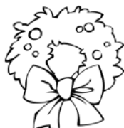
une petite couronne.