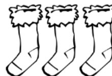
trois chaussettes bleues .