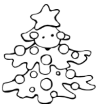
un grand sapin.

Il indique comment est la personne, l'animal, la chose ou le lieu.