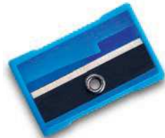
a pencil sharpener