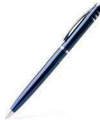
a blue pen