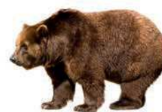
a grizzly bear