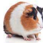
a guinea pig