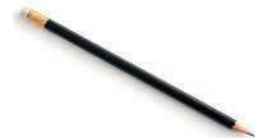
a drawing pencil