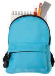
a school bag

What is it? It's a pencil. It's a blue pencil.