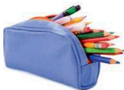
a pencil case