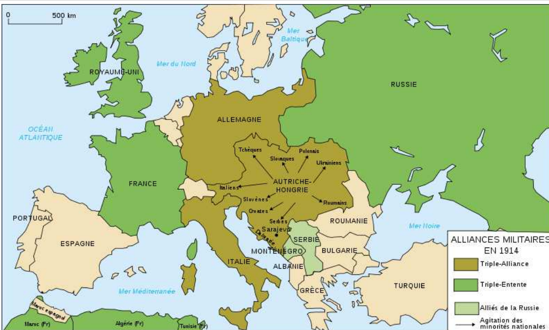
Doc B : les alliances en Europe en 1914

Chaque pays voulait être prêt à se défendre en cas de conflit. Des alliances se créèrent. Tous les pays engageaient beaucoup d'argent pour fabriquer des armes : c'est la course aux armements. Malgré les appels à la paix, la haine pour les nations voisines se développait.