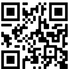
L'école en 1960